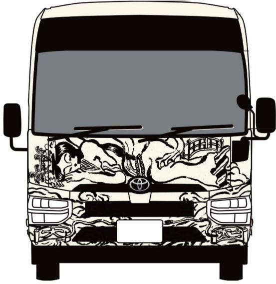
フロント (イメージ)