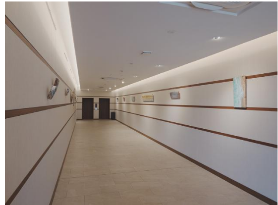
アートギャラリー 一例

「別府温泉 杉乃井ホテル」のコミュニケーションコンセプトは「君としあわせ。」大切な人と過ごすかけがえない時間と、心からの笑顔に包まれる喜び。そんな一瞬一瞬が積み重なり、特別な思い出となるようなリゾート体験をお届けしてまいります。