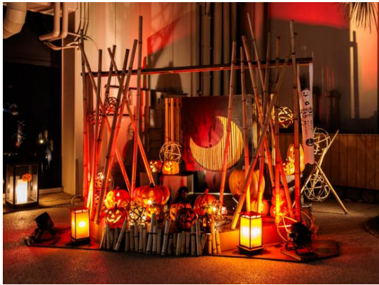
竹細工ハロウィン装飾

2021年にオリックスグループは「地域共創プロジェクト」を開始し、新たなチームを発足しました。オリックス不動産・立命館アジア太平洋大学と産学連携「友好交流に関する協定」を締結。将来の観光産業を担う人材の育成と地域活性化を目的に、オリックスグループのもつ経営ノウハウなどを学生達が学びながら、地域の課題や新しい観光資源を創出する取り組みを行っています。また、別府市の伝統工芸品“竹細工”の認知拡大に寄与するため、竹細工とハロウィンを組み合わせたイルミネーション、竹灯りを行うなどの活動を行ってきました。杉乃井ホテルは、今後も地域の新たな魅力を発信し、地域の皆さまと共に歩んでいきます。