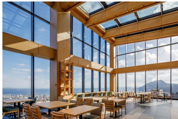
「和ダイニング星 HOSHI」内一部