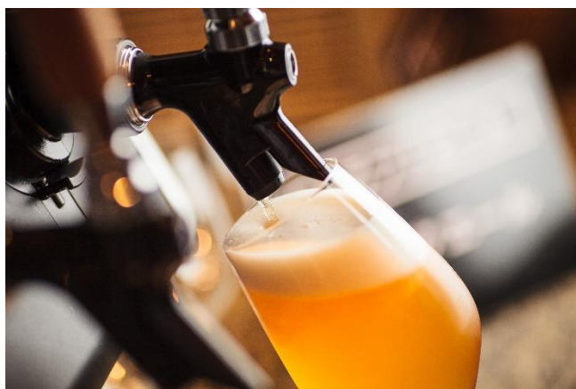
クラフトビール イメージ