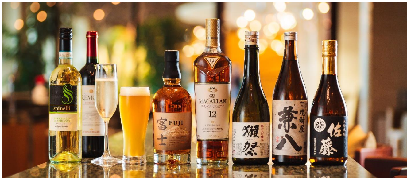
TERRACE & DINING SORA 飲み放題メニュー イメージ

別府温泉 杉乃井ホテル（所在地：大分県別府市、総支配人：鞍馬 達也、以下「杉乃井ホテル」）は、ビュッフェレストラン「TERRACE & DINING SORA」にて、夏休み限定で行っていたアルコール飲み放題をご利用いただいた多くのお客さまにご好評をいただき 2024年9月より継続していますのでお知らせします。