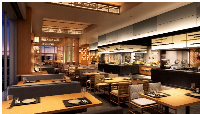
「和ダイニング星 HOSHI」イメージ