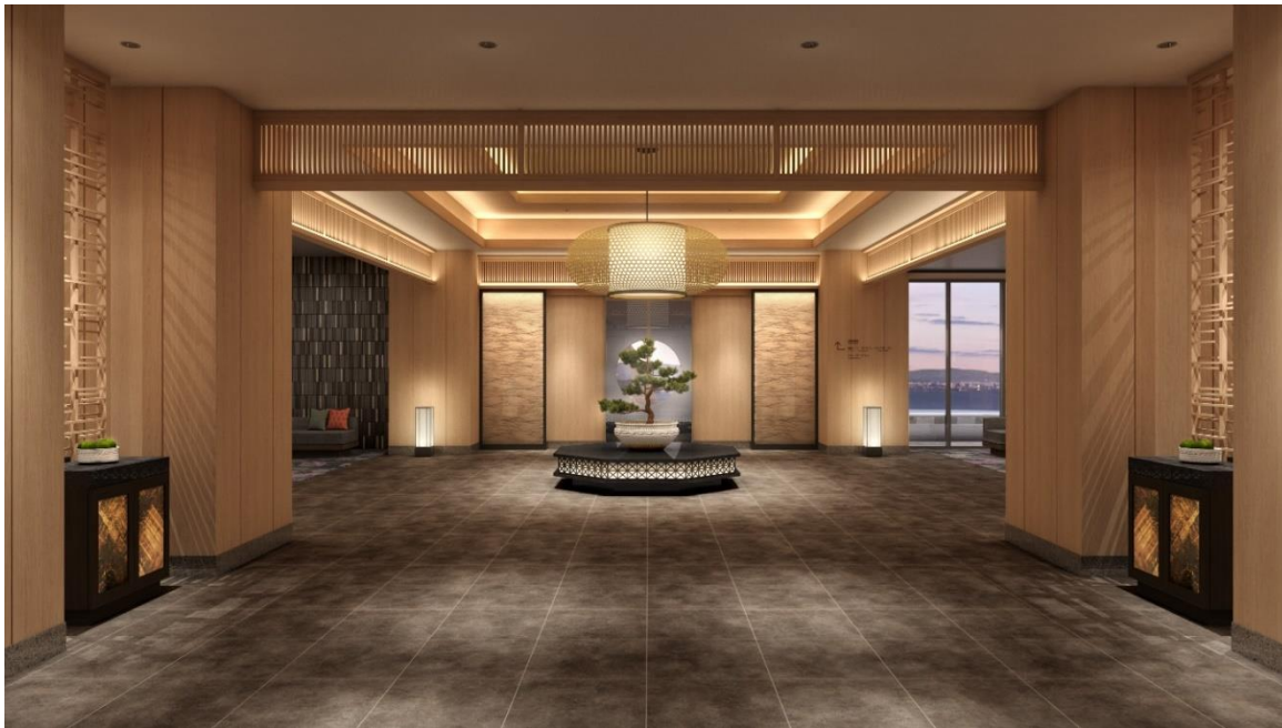
「星館」エントランス イメージ

別府温泉 杉乃井ホテル： https://suginoi.orixhotelsandresorts.com/