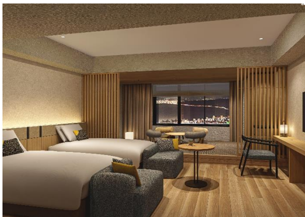
デラックス和洋室（海側）イメージ

温泉旅館の風情を感じていただける、スイートからスタンダードタイプまで5つの部屋タイプをご用意。2名様～6名様までご利用いただけます。客室のカラーコンセプトは「夜半（よわ）」「宵（よい）」「暁（あかつき）」の3つで、夜の始まりの空から深い夜の空、夜明け前の空に浮かぶ星のひかりをイメージしています。棚湯やお食事を堪能した後、大切な人との会話を楽しみながら、くつろぎの時間をお過ごしください。