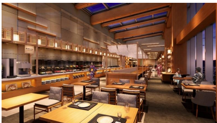
「和ダイニング星 HOSHI」イメージ