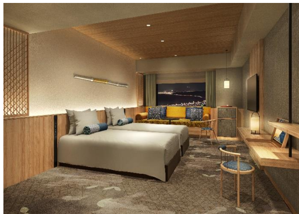
プレミアムスタンダード洋室（海側）イメージ