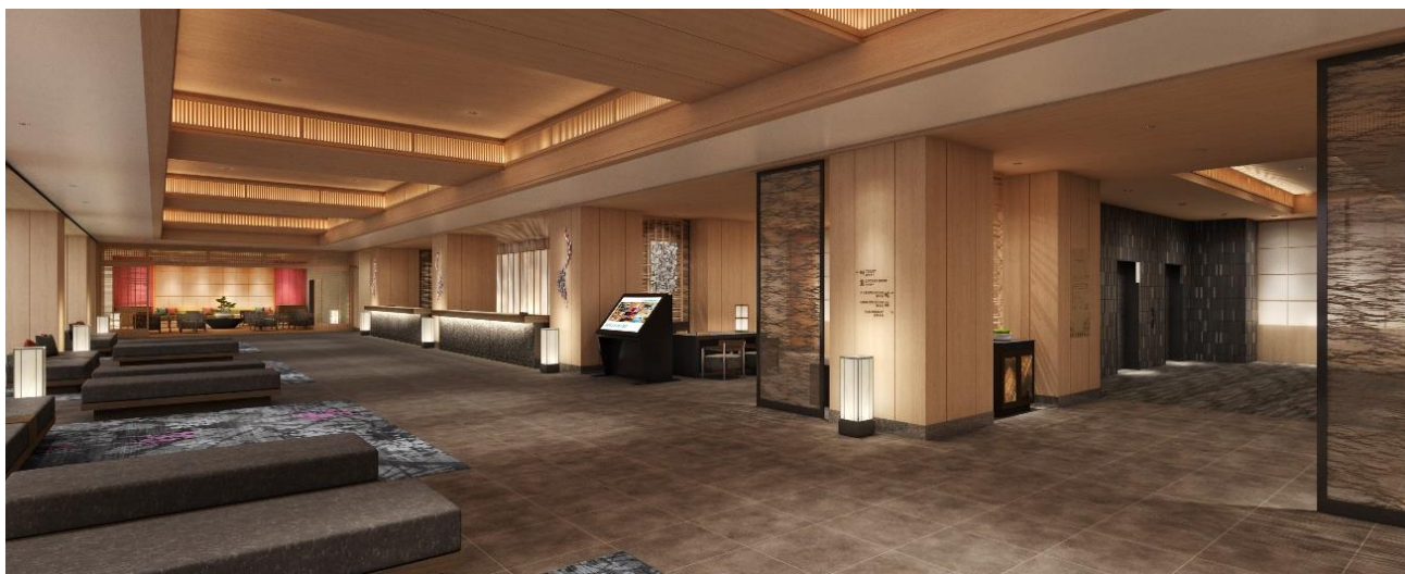
「星館」ロビー イメージ

温泉旅館の懐かしさを感じられる和モダンテイストのロビー。別府湾を望む景色を主役とした1階のロビーには、テラスを設けています。別府市街地を見わたす眺望と別府湾との水面のエッジが一体化した、インフィニティの水盤テラスとなっています。ご滞在中の思い出の1ページにおすすめの場所です。