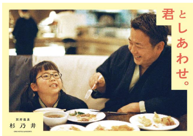
「君としあわせ。」イメージ

新生・杉乃井ホテル、充実の施設と多彩なコンテンツの温泉リゾートを目指して本格始動