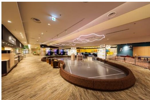
SUGINOI BOWL & PARK

既存の概念に留まらず付加価値を常に提供してきた杉乃井ホテルは、新たなマイルストーンの季節を迎えます。明日開業する「宙館」は、敷地内でのアクティビティを楽しみながら静かでのんびりとした温泉滞在を楽しみたい大人のお客さまにも新たなリゾートタイムをご提案します。同日オープンする「SUGINOI BOWL & PARK」では、ボウリング、ポッチャ、卓球、ダーツ、ビリヤード、カラオケ、デジタル射的など、多彩なアクティビティを満喫いただけます。昨年12月からは、水着で楽しむ屋外型温泉「アクアガーデン」において、水と光と音が織りなすダイナミックな新たな噴水ショー「AQUA DREAMS 湯街夢夜（アクアドリームズ ゆのまちゆめや）」がスタートし、最新鋭のナイトエンターテインメントショーをお楽しみいただいています。