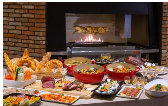
TERRACE & DINING SORA メニュー例

※「宙館」に関する詳細は、2022年10月26日のプレスリリースをご参照ください